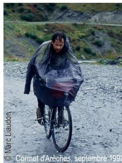
Cornet d'Arêches, septembre 1990