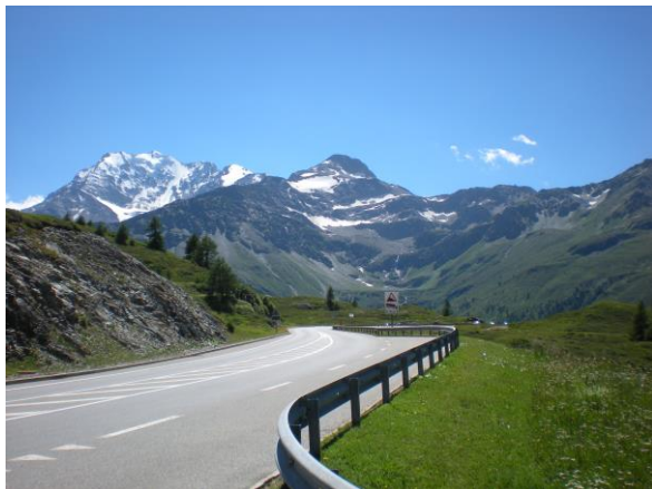
La montée du Col du Simplon