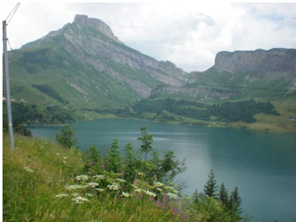
Le Cormet de Roselend