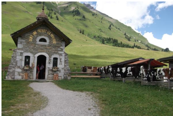
La chapelle St Anne au col des Aravis